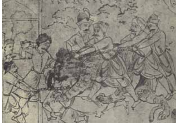
۵ معین مصور