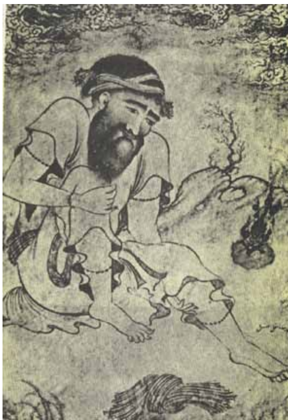
معین مصور افضل الحسينی ۱۰ ۱۱