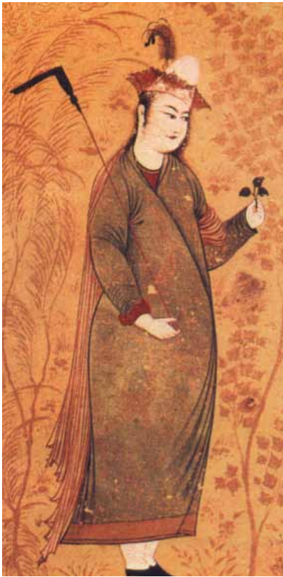
۱۷ افضل الحسينى