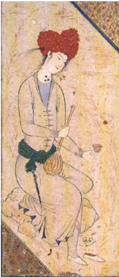
۲۱ رضا عباسی