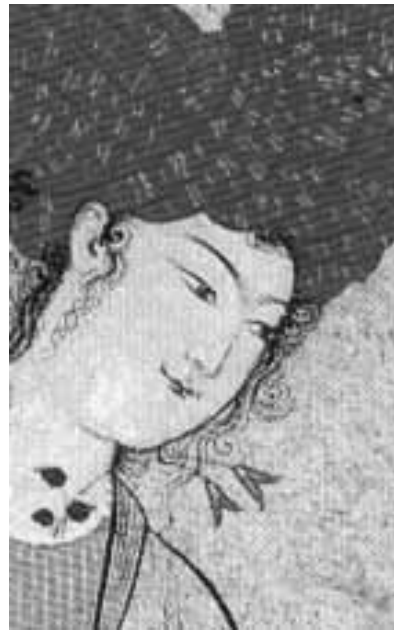
جزئی از تصویر