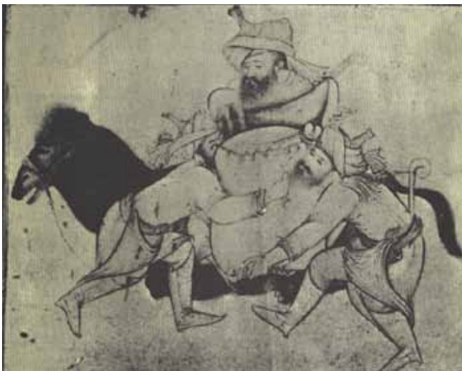
۳ سه مرد باری را بر پشت شتر قرار می دهند (ناشناس)