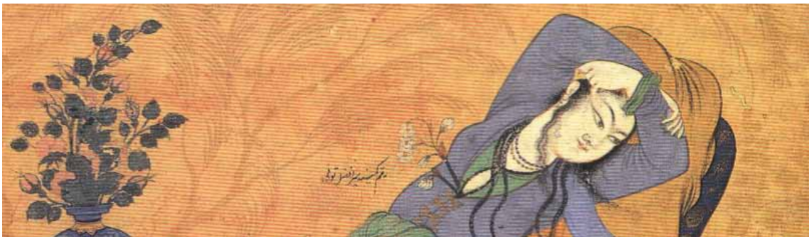
۷ رضا عباسی