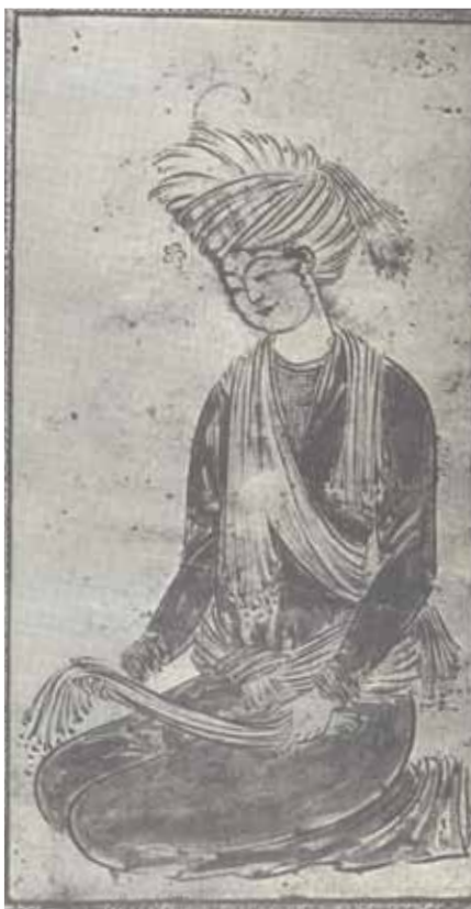
۹ رضا عباسی