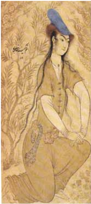
۲۰ رضا عباسی