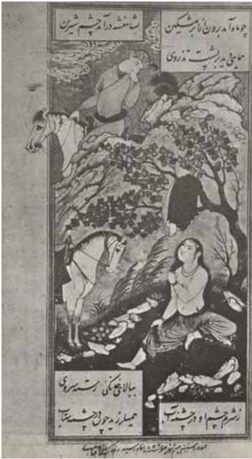
۶ رضا عباسی