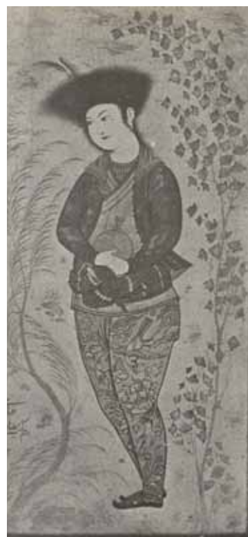
۲۲ رضا عباسی

(ناشناس) ترکیب نقش روی بالشت و فضای پس زمینه