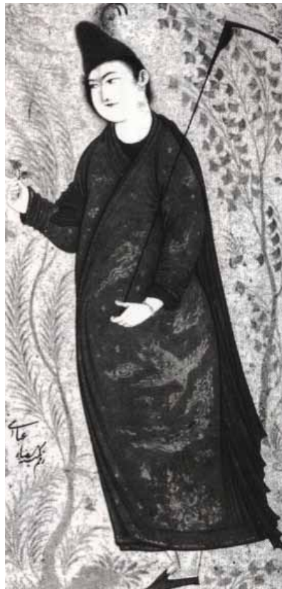
۱۸ رضا عباسى